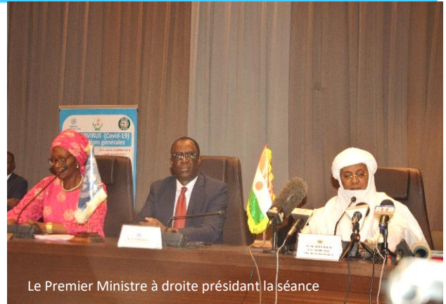
Le Premier Ministre à droite présidant la séance