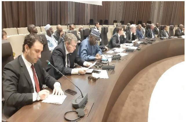
Vue des partenaires au séminaire gouvernemental