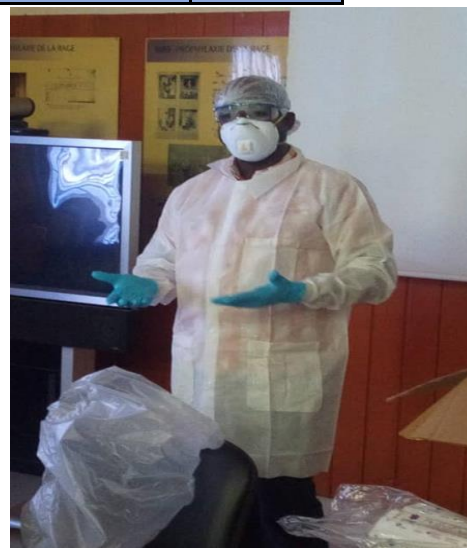
Formation sur le port des EPI