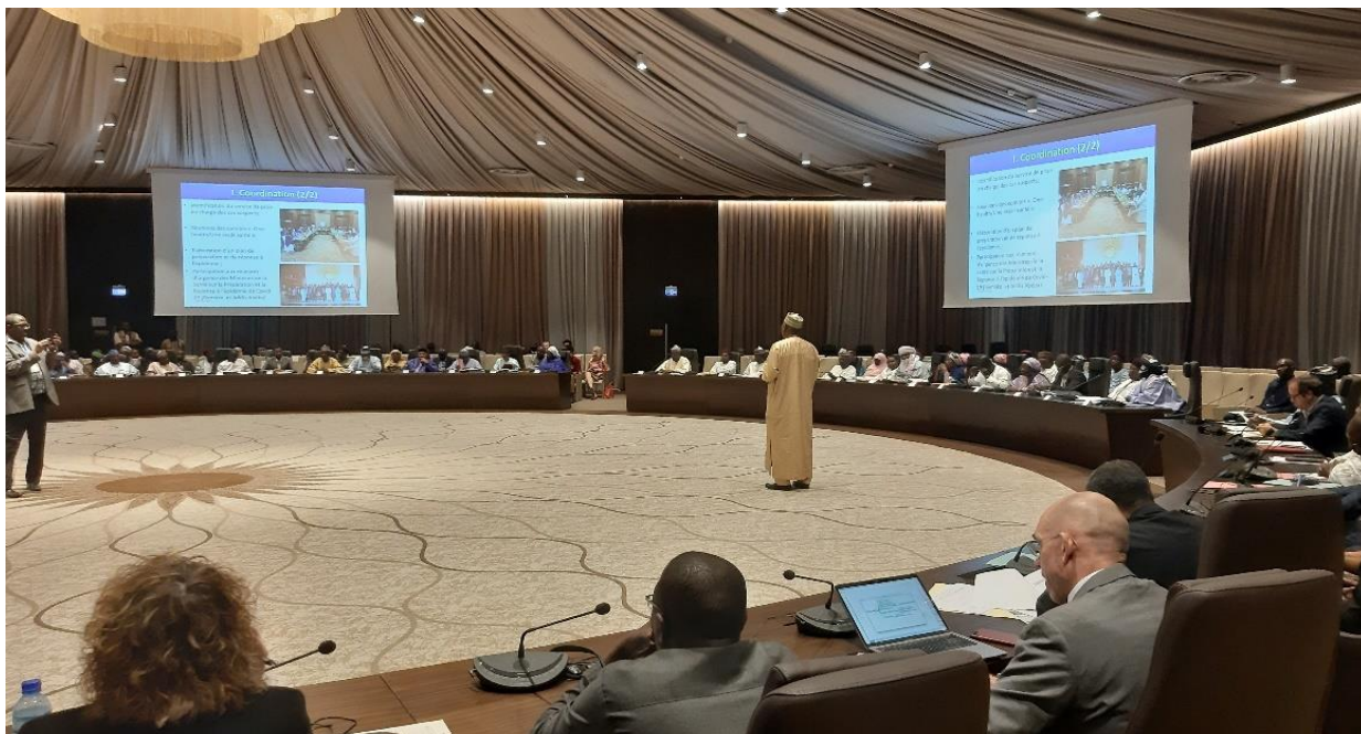
Intervention du Secrétaire Général du Ministère de la santé au séminaire gouvernemental