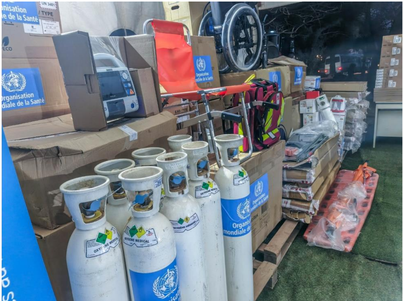
Matériel médico-technique remis : bouteilles d'oxygène, moniteurs défibrillateurs, brancards et fauteuils roulants