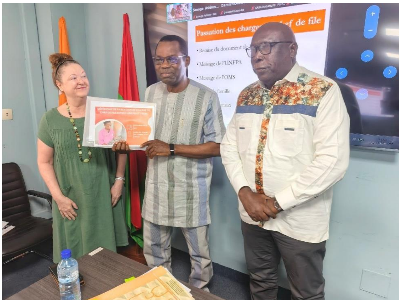
Cérémonie officielle de passation de charges entre l'UNFPA et l'OMS, Ouagadougou, 29 janvier 2026

Le 29 janvier 2026, une cérémonie officielle a consacré l'OMS comme nouveau chef de file des PTF en santé, succédant à l'UNFPA soutenu par la Banque mondiale.