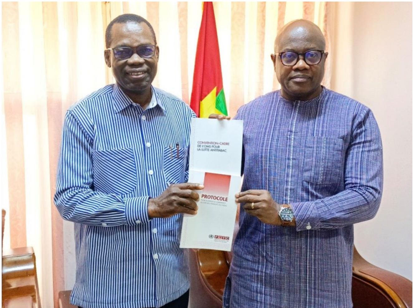
Audience du Ministre de la Santé avec la délégation OMS et experts FCTC, mars 2026

Le Ministre de la Santé a également reçu une délégation de l'OMS accompagnée d'experts du Secrétariat de la Convention-cadre pour la lutte antitabac (FCTC) et de l'OMS Afrique. Cette mission d'évaluation (16–20 mars 2026) a réaffirmé l'engagement indéfectible du Burkina Faso à protéger la santé publique.