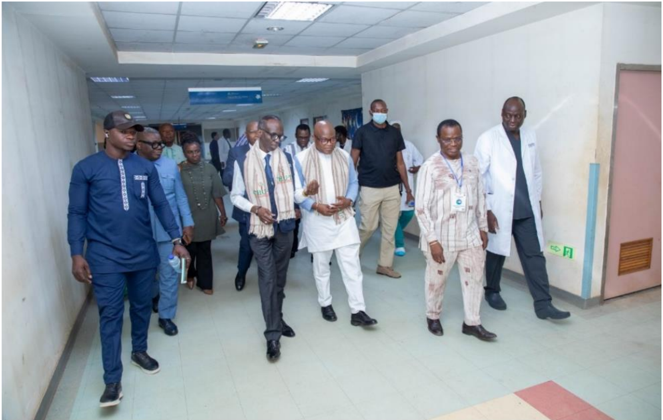
Tour des installations du CHU de Tengandogo, réputé pour son excellence en chirurgie cardiaque