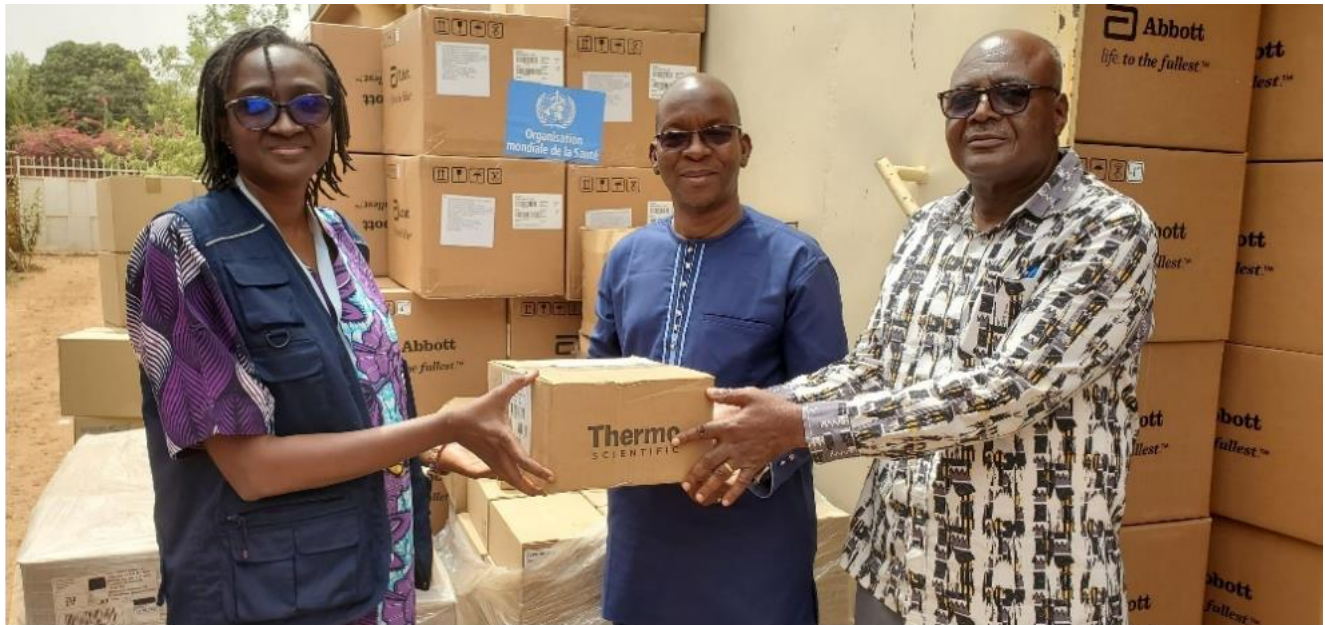
Cérémonie de remise des réactifs et consommables de laboratoire, Ouagadougou 2026

L'OMS renforce les capacités diagnostiques des formations sanitaires nationales grâce à un don essentiel financé par le Fonds Mondial et le Pandemic Fund.