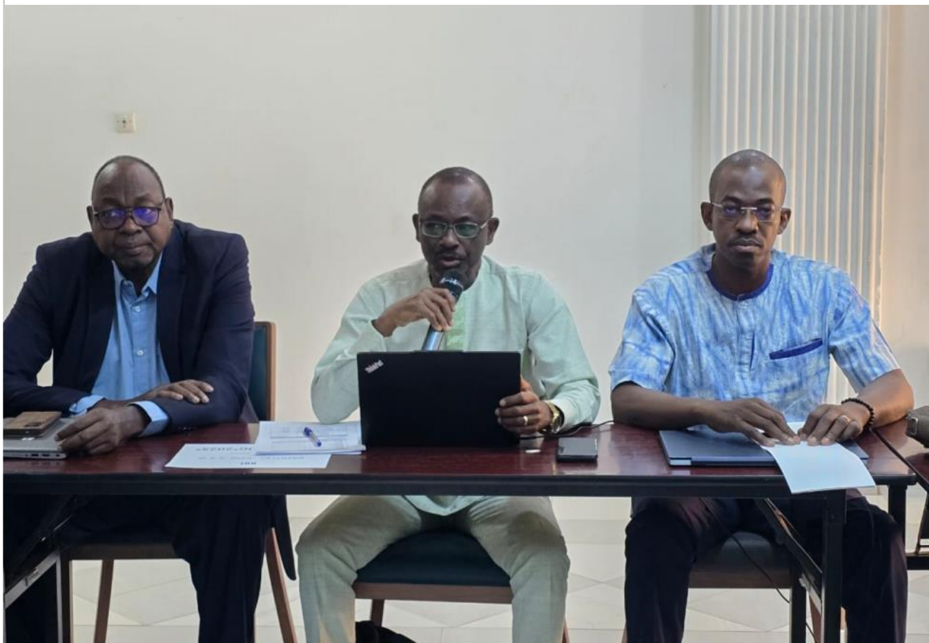
Atelier de finalisation du Plan Stratégique National d'Élimination du Paludisme 2026–2030

En 2025, le pays a enregistré 7 349 425 de cas avec 1961 décès . Ces chiffres, quoiqu'en nette réduction par rapport aux années précédentes, restent inacceptables pour une maladie pour laquelle il existe des moyens efficaces de prévention de diagnostic et de traitement. Les enfants et les femmes enceintes payent le plus lourd tribut.