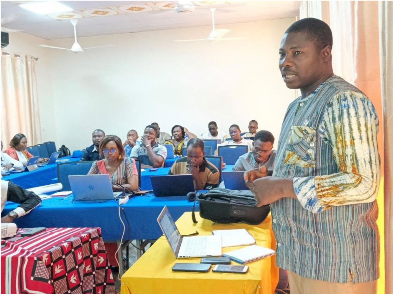
Formation en ligne CIM-11 : renforcement des compétences des professionnels de santé, mars 2026

Une plateforme de formation en ligne sur la CIM-11 est paramétrée pour étendre la certification médicale des décès dans tous les hôpitaux du Burkina Faso.