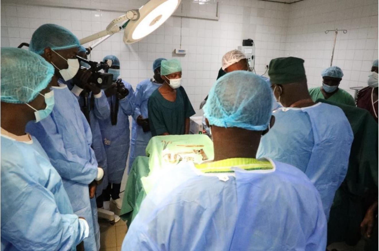
Journée mondiale des maladies tropicales négligées (MTN) : les participants assistent à une opération de cure d'hydrocèle – Burkina Faso, janvier 2026

L'OMS aux côtés du Ministère de la Santé pour plaider en faveur d'une lutte accrue contre les maladies tropicales négligées qui touchent les communautés les plus vulnérables.