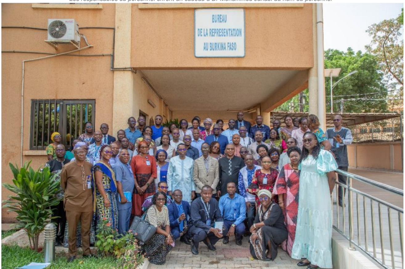
Le personnel de OMS Burkina très satisfait de la visite du directeur régional et de sa délégation