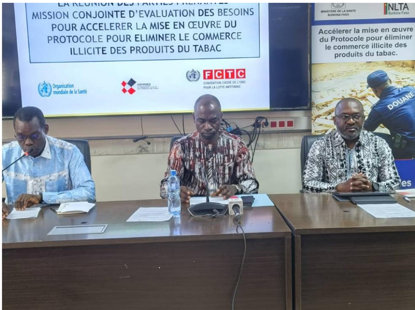
Réunion stratégique des parties prenantes, Ouagadougou, 17 mars 2026

Le 17 mars 2026, une réunion stratégique multisectorielle a évalué les besoins pour éliminer le commerce illicite des produits du tabac au Burkina Faso.