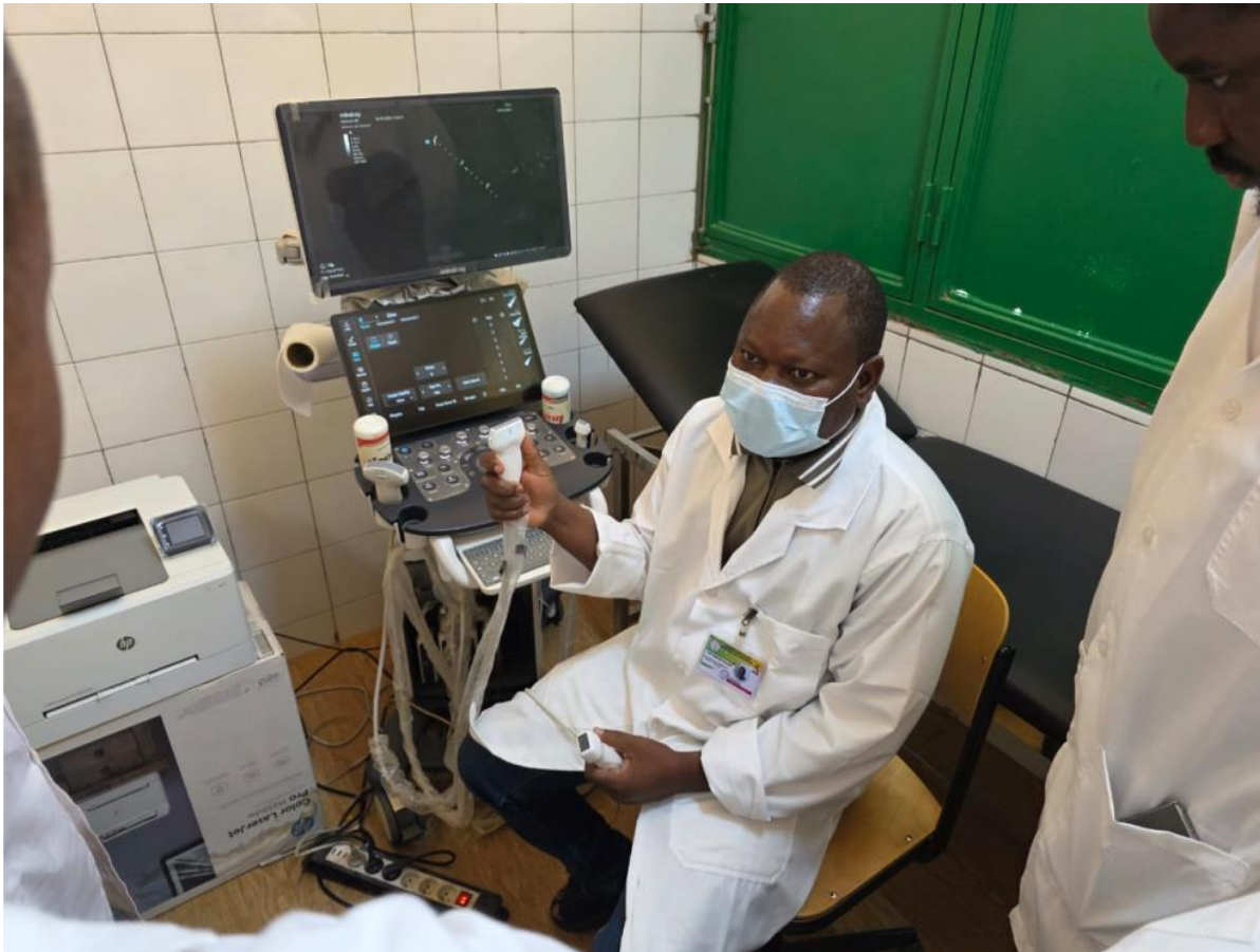
Formation des formateurs au CHR de Tenkodogo, 30 mars – 3 avril 2026

Du 30 mars au 3 avril 2026, 35 professionnels de santé ont été formés aux protocoles PEN-Plus pour mieux détecter et traiter l'hypertension et le diabète.