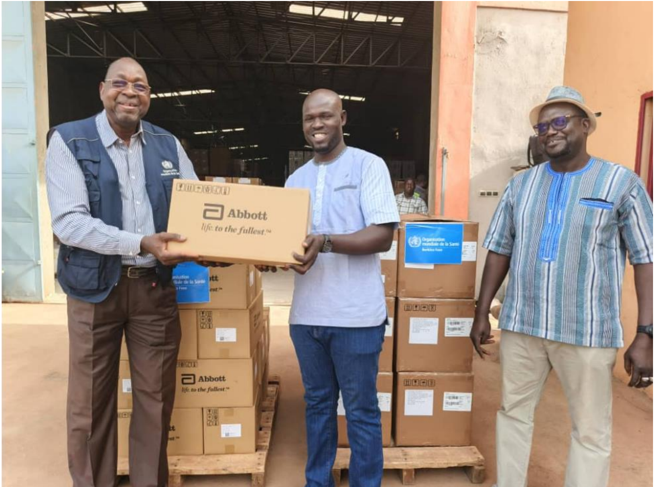
Remise de réactifs de dépistage des hépatites virales B et C au Ministère de la santé.

Des réactifs essentiels pour le dépistage de l'hépatite B et C remis au ministère de la Santé, grâce au soutien de la coopération italienne.