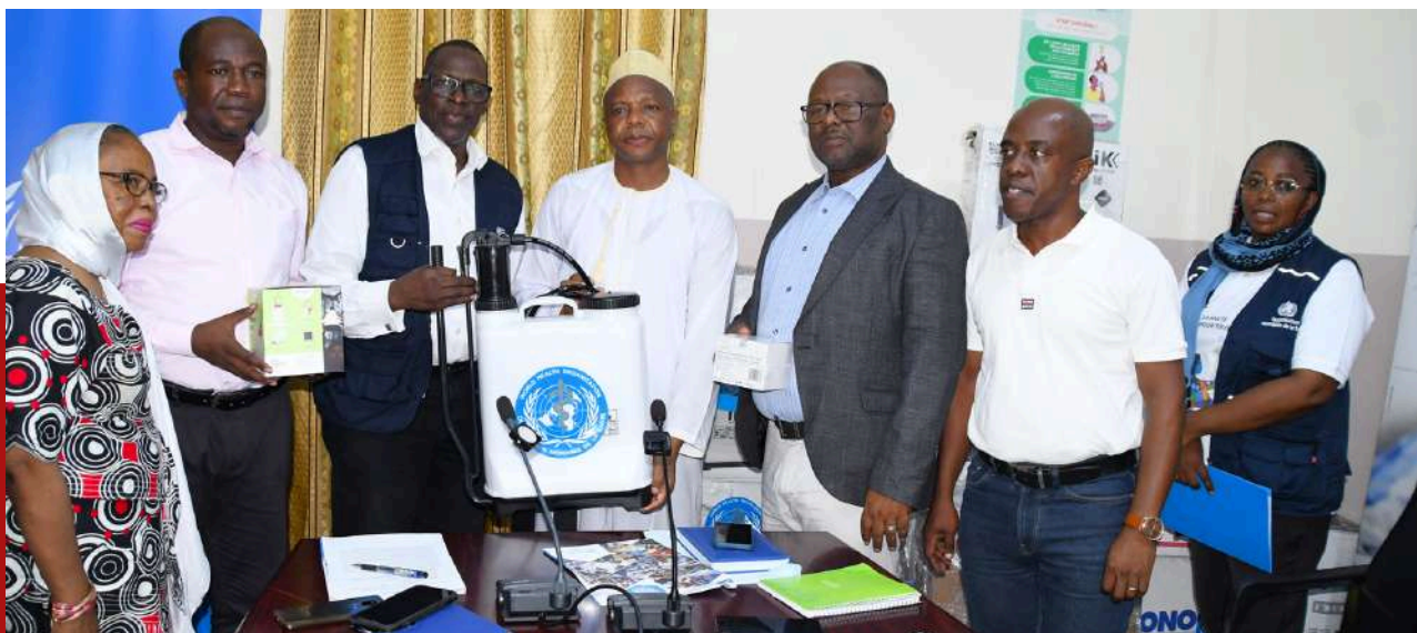
De gauche à droite : Directeur de la lutte contre la maladie, le Directeur général de la Santé, la Responsable des Urgences auprès de l'OMS et le Directeur de la promotion de la Santé.