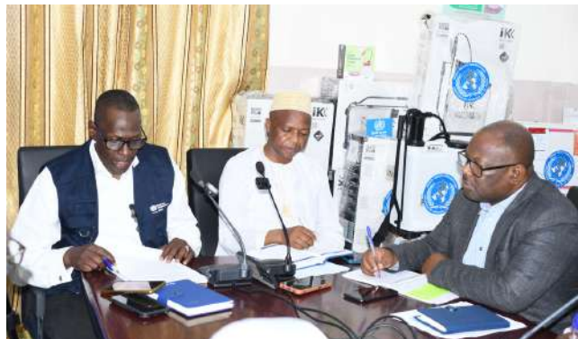
De gauche à droite : Directeur de la lutte contre la maladie, le Directeur général

Au nom de la ministre de la santé, son homologue de l'éducation nationale assurant son intérim a remercié l'OMS qui vient renforcer les efforts en cours dans la riposte contre l'épidémie de Choléra.