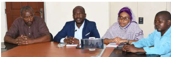
De gauche à droite : Directeur de la lutte contre la maladie, le Directeur général

Dans la soirée, c'est la Ministre de la Santé en personne qui déclarera officiellement que les Comores font désormais face à une nouvelle épidémie de choléra, invitant ainsi toute population à prendre toutes les mesures de prévention.