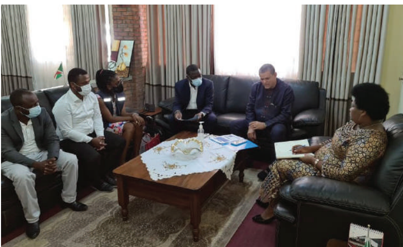
La délégation d'experts OMS AFRO conduite par le Représentant échangeant avec le Ministre de la santé.

Durant leur séjour les 4 experts ont eu à établir l'état des lieux du système de la surveillance génomique au Burundi et identifier les actions pour améliorer les capacités de séquençage et de surveillance génomique dans pays.