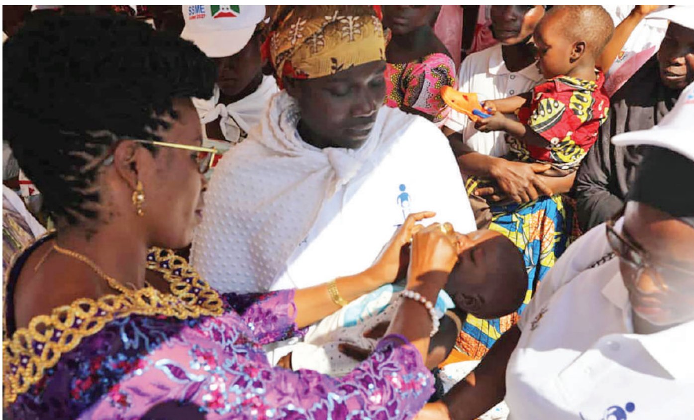
La Première Dame administrant le vaccin à un enfant lors du lancement de la SSME 2022.

« En améliorant la santé de la mère et de l'enfant, le Burundi participe activement à l'objectif de couverture sanitaire universelle ». Ainsi s'exprimait, le Représentant de l'OMS au Burundi adressant ses chaleureuses félicitations au Gouvernement burundais pour l'organisation de la 22ème édition de la Semaine dédiée à la Santé de la Mère et de l'Enfant (SSME). Un évènement d'une haute portée sanitaire que le pays organise deux fois par an depuis 2002 pour renforcer l'engagement des communautés et du système de santé à la promotion de la santé de la mère et de l'enfant.