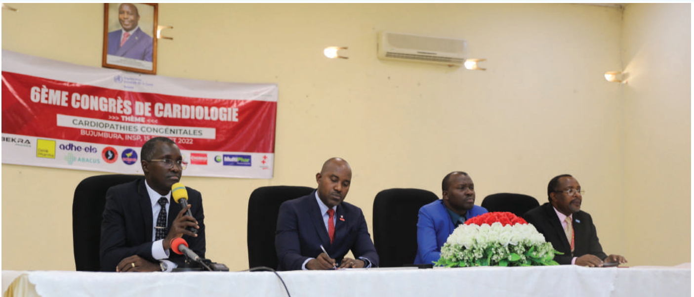
Vu du Présidium lors de l'ouverture du congrès.

La Société burundaise de cardiologie (SBC) a tenu le 15 juillet à Bujumbura son 6ème Congrès annuel, sous le thème « les cardiopathies congénitales ». Occasion pour faire le point sur ce sujet, identifier les défis et partager les bonnes pratiques. Il s'agissait pour les participants d'échanger les expériences dans un cadre multidisciplinaire sur les acquis en matière de diagnostic et de prise en charge des cardiopathies congénitales et sensibiliser la population sur la prévention de la pathologie.