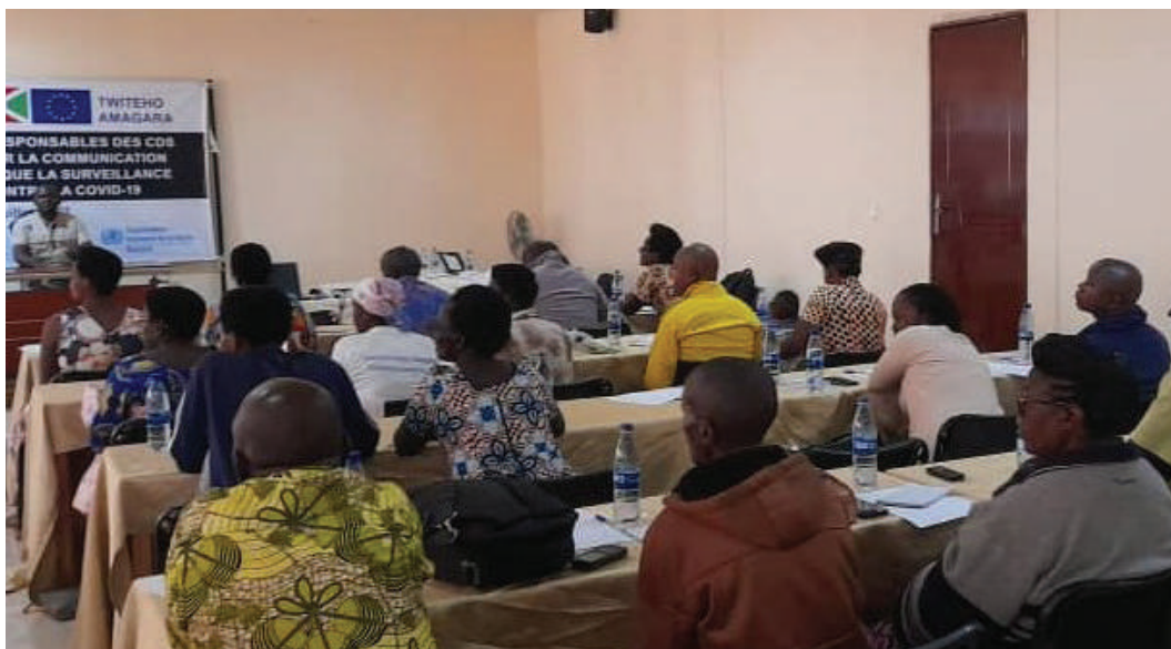
Vue d'ensemble des participants à l'atelier de formation.

Cette session qui s'est tenue du 18 au 22 Juillet visait à former les Groupements d'agents de santé communautaire (GASC) de la province de Rumonge et de Bujumbura mairie sur les techniques de communication