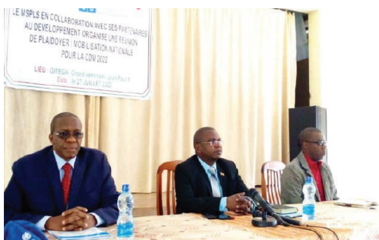
Le Secrétaire Permanent du MSPLS (au centre) et Dr Baza (à droite), délégué de l'OMS.

La campagne prévue du 6 au 18 septembre 2022 permettra de distribuer près de 6,6 millions de moustiquaires et va contribuer à inverser les tendances de la maladie au Burundi et à l'atteinte des objectifs de réduction de l'incidence du paludisme 2016-2030.