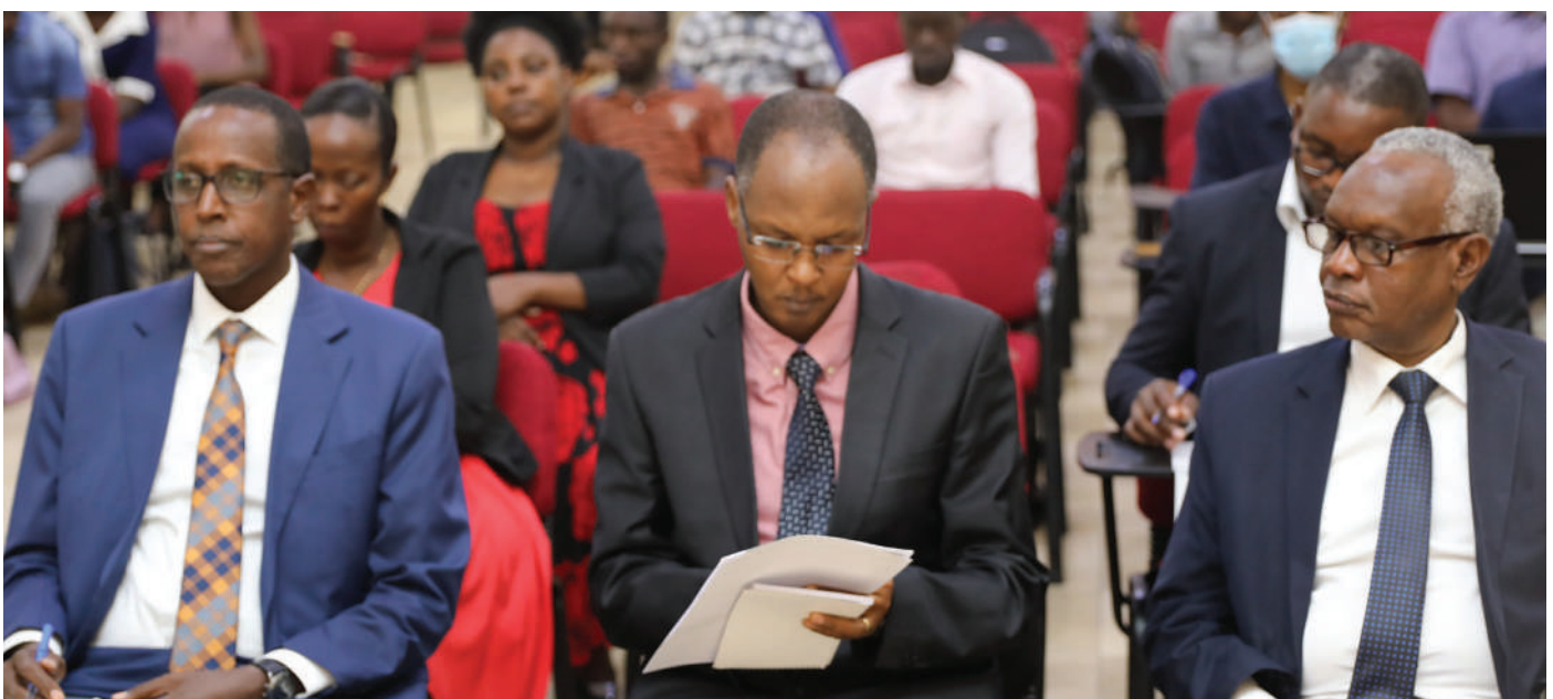
Vue partielle des participants au congrès.

L'OMS a renouvelé son engagement à soutenir les efforts du Gouvernement en collaboration avec les partenaires au développement, pour alléger aux Burundais le fardeau des MNT en général et les cardiopathies congénitales en particulier.