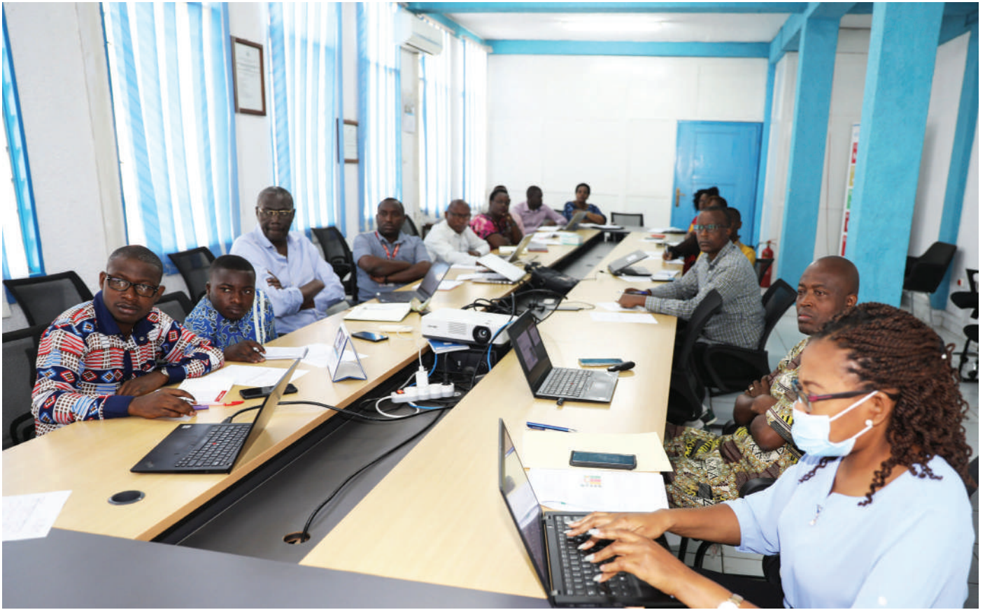
Vue d'ensemble des participants.

La salle de réunion du siège de l'OMS au Burundi a servi de cadre, le 08 Juillet 2022 pour une formation des points focaux des organisations membres du secteur de la santé sur la protection transversale et la redevabilité en vue de la prise en compte effective de ces concepts dans mise en œuvre des projets de santé.