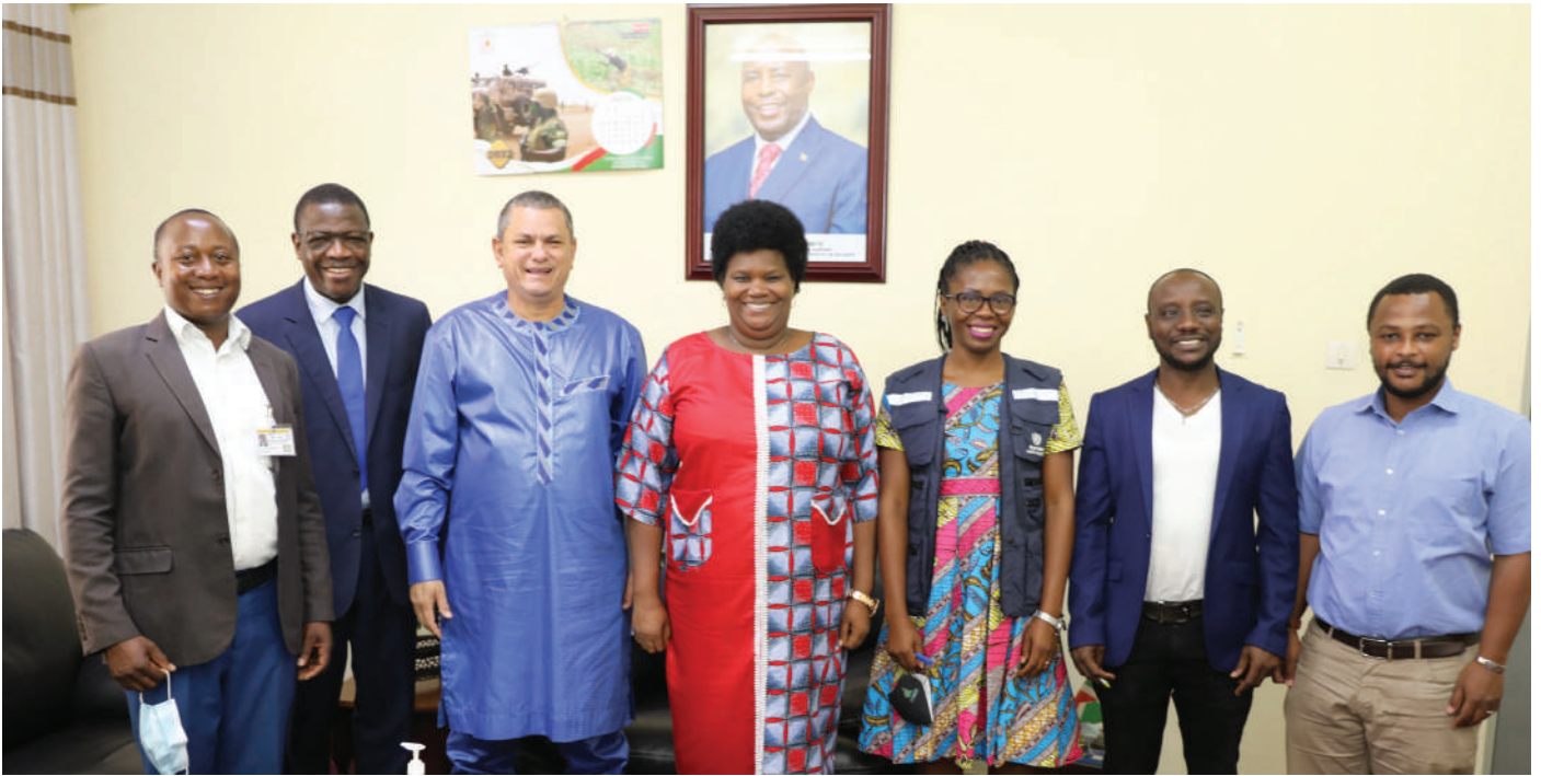
L'équipe d'experts OMS AFRO aux côtés du Ministre en charge de la Santé et le Représentant de l'OMS;