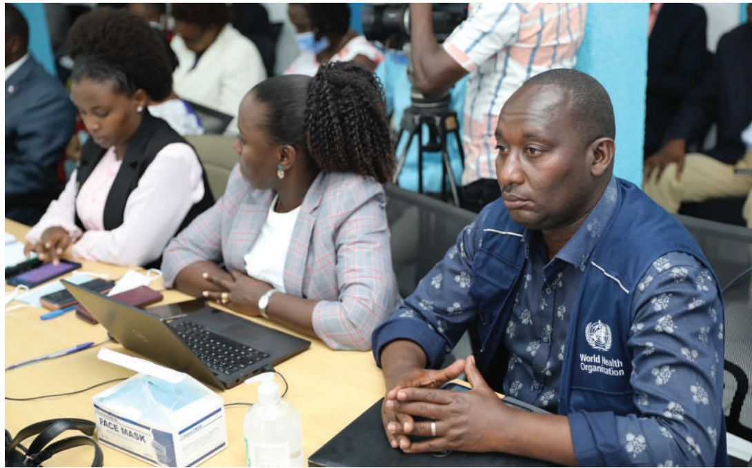
Une vue partielle des participants à la réunion.

financement solide ; et la promotion de la recherche et des innovations technologiques pour promouvoir la santé ; l'objectif poursuivi étant de « Permettre à tous de vivre en bonne santé et promouvoir le bien-être de tous à tout âge ».