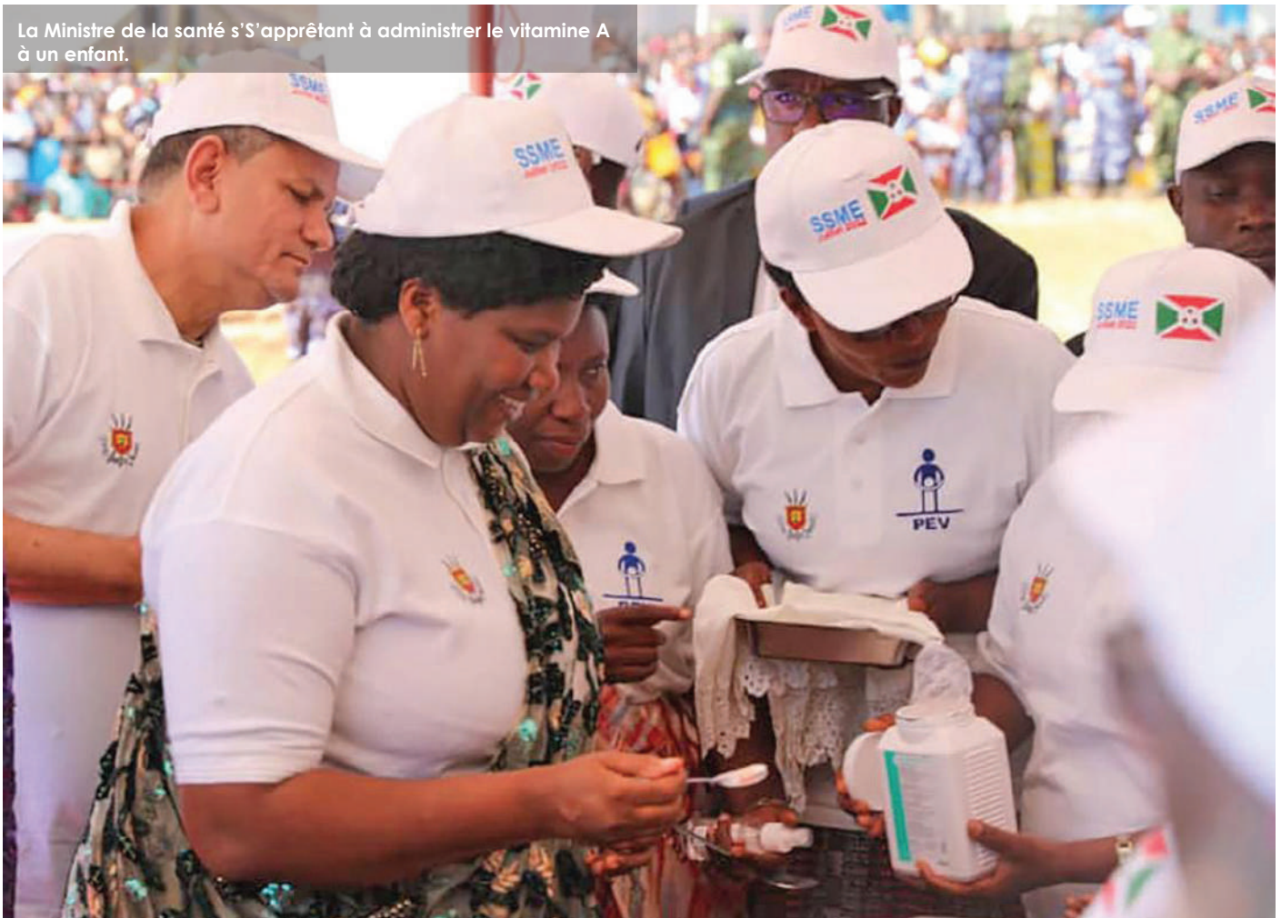
La Ministre de la santé s'apprêtant à administrer le vitamine A à un enfant.