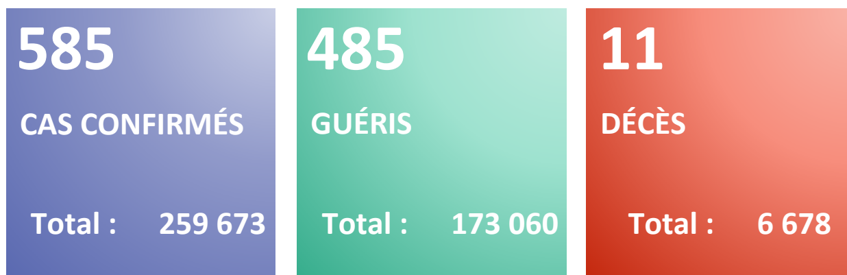
Figure 1 : Evolution du nombre quotidien de nouveaux cas confirmés et nouveaux décès par COVID-19 du 25 février 2020 au 09 février 2022 en Algérie

Rapport N° 681 Date du rapport : 10 février 2022 Date des Données : 9 février 2022