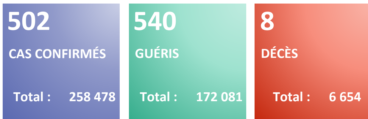
Figure 1 : Evolution du nombre quotidien de nouveaux cas confirmés et nouveaux décès par COVID-19 du 25 février 2020 au 07 février 2022 en Algérie

Rapport N° 679 Date du rapport : 8 février 2022 Date des Données : 7 février 2022